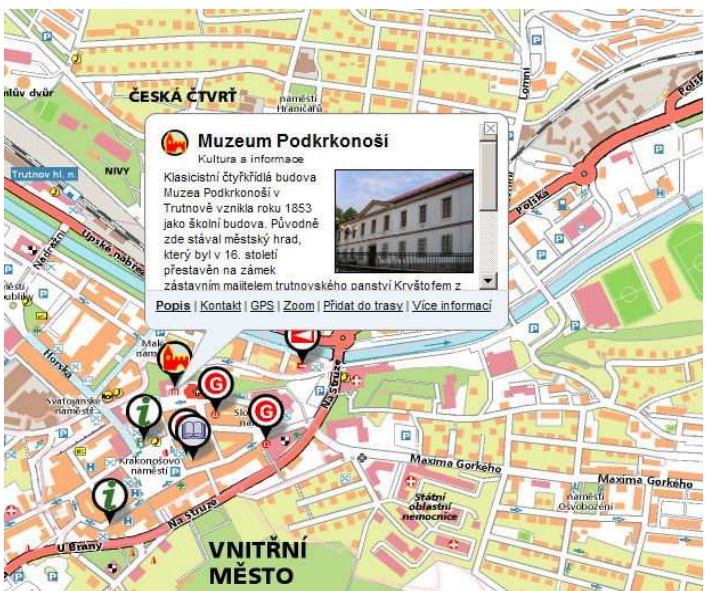
Detailní informace o bodu zájmu (text, fotografie, kontaktní informace)