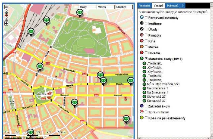
Zobrazení bodů zájmu nad mapou